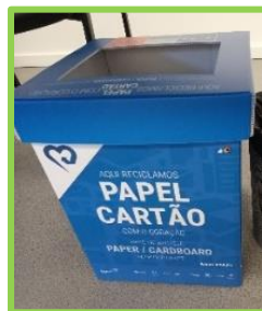
Exemplos sugestivos: Escritórios ou gabinetes individuais

Sugerimos instalar equipamento Lipor para a entrega de papel de escrita e pequenas embalagens de cartão.