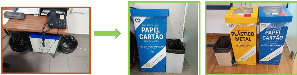
Exemplos sugestivos: Escritórios ou gabinetes de médias/grandes dimensões.