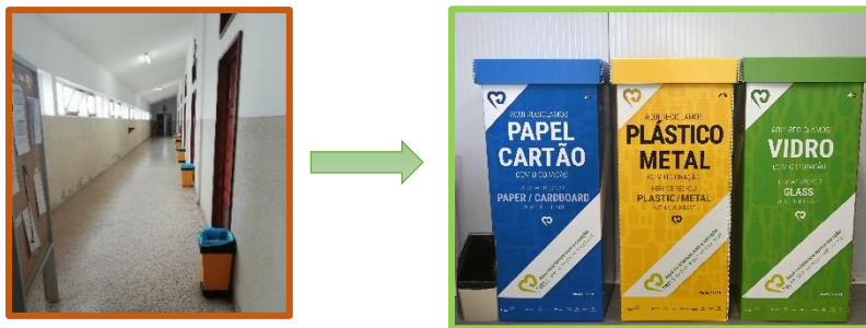
Exemplos sugestivos: Casernas