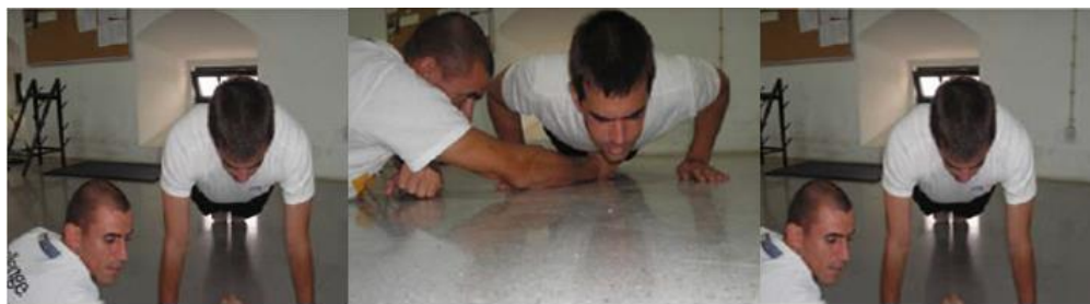
Figura 2 – Execução de extensões de braços no solo