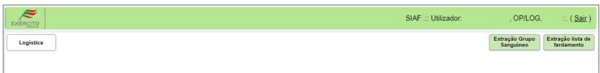
Figura 2 - Landing page Operador de Logística (OP/LOG)