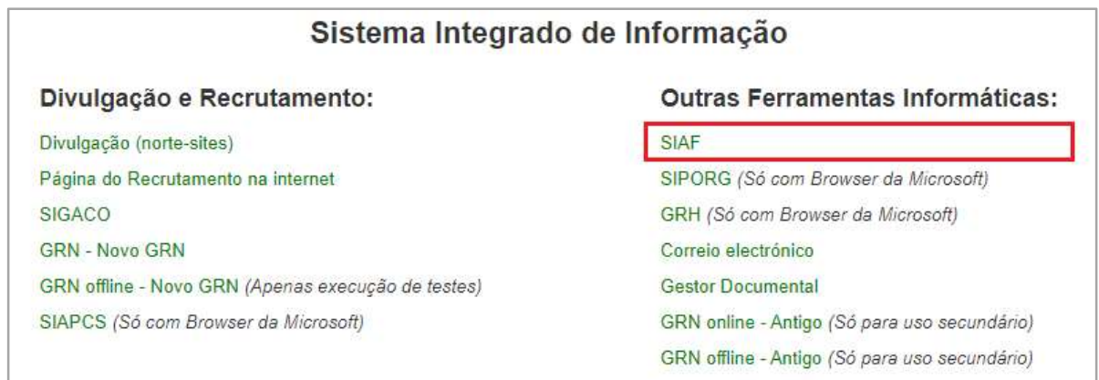
Figura 1 – SIIRE - Link de acesso ao SIAF