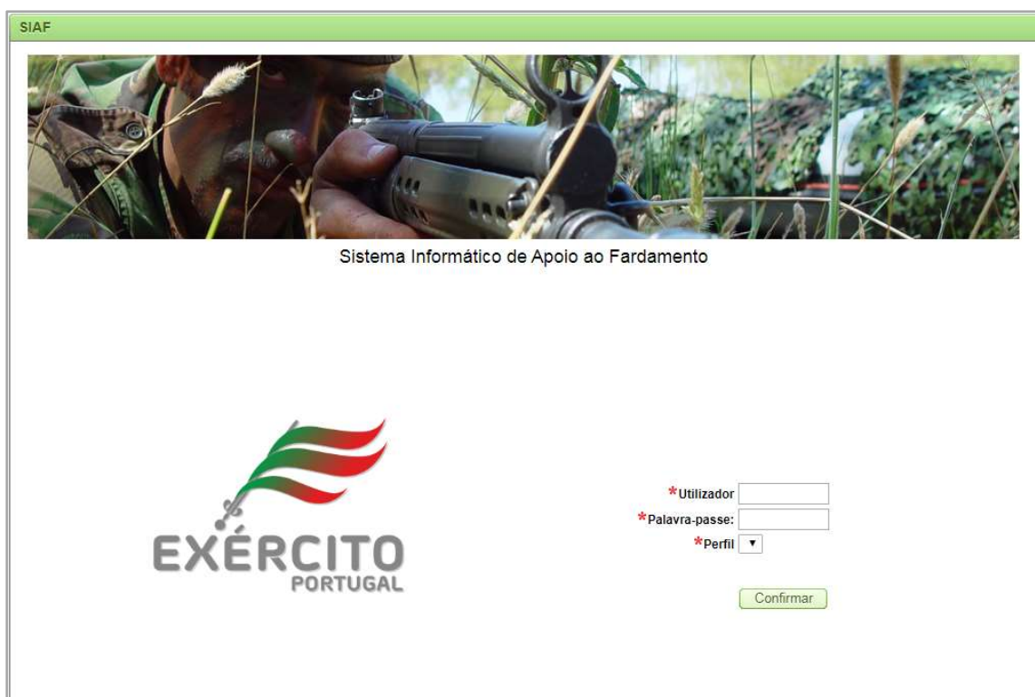
Figura 2 - Login na plataforma